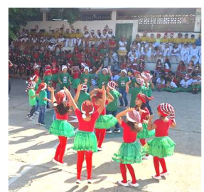
Weihnachtsfeier 2024 in der Prosperina Schule

Mit lieben Grüssen, ein herzliches Dankeschön für Ihre Unterstützung und schöne, besinnliche Feiertage wünscht Ursula Weibel und das Lyssa Team